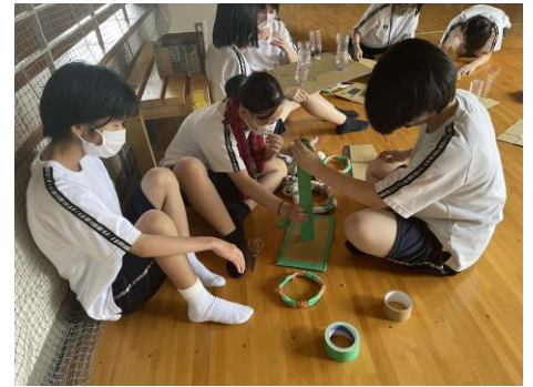
クラス発表・学年展示 当日の様子