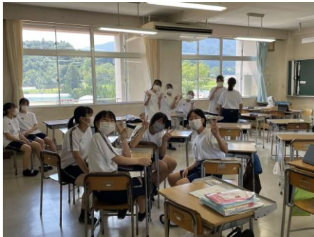
クラス発表・学年展示 準備風景