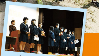
「未来フォーラム」を 普通科、産業技術科合同で開催

中国地区代表校として表彰され、全国の代表9校のひとつに選ばれました。矢上高校の歴史において誇るべき大きな成果を上げ、本校の魅力を全国に発信することができました。この経験を糧に大きく成長していきます!