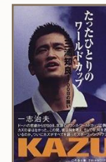
『たったひとりのワールド カップ 三浦知良1700日 の闘い』一志治夫著