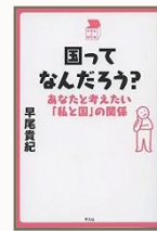
『国ってなんだろう？（中学生の 質問箱）』早尾貴紀著