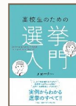
『高校生のための選挙入門』 斉藤一久著