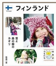
『フィンランド 雪と森の国のカオリ』

フィンランドを代表するキャラクター、ム ○○○。その物語の世界を楽しめるパ ークが3月16日埼玉県にオープン♪