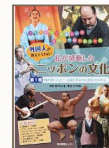
『外国人が教えてくれた！私が感動したニッポンの文化』全3巻