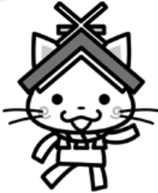
島根県観光キャラクター 「しまねっこ」 「島観連許諾第1725号」