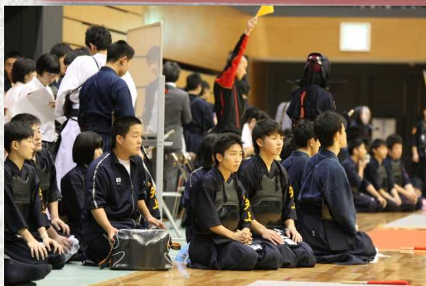
剣道部男子総合 5位