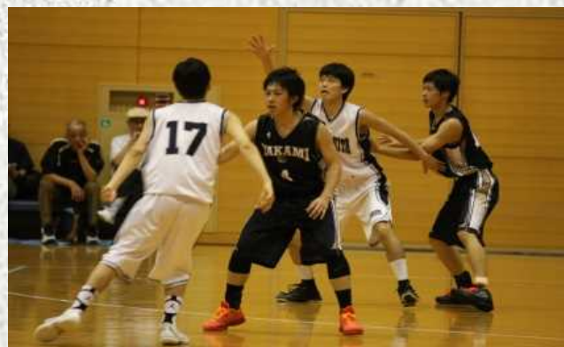
男子バスケット部ベスト8

総体得点は■スキー同好会が14点、■卓球部女子、■剣道部、■男子バスケット部が健闘しそれぞれ総体得点7点を獲得しました。