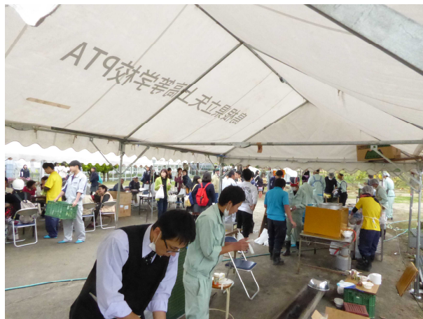
昨年の産業祭の様子

詳細は決まりしだい矢上高校ホームページに掲載します。当日は「産業祭」も実施されます。新鮮な野菜や、人気のスイーツ販売など盛りだくさんです。第1回のオープンスクールに参加できなかった方はもちろん、第1回に参加された方もぜひこの機会にお越しいただき、普段の矢高生の姿をご覧ください。