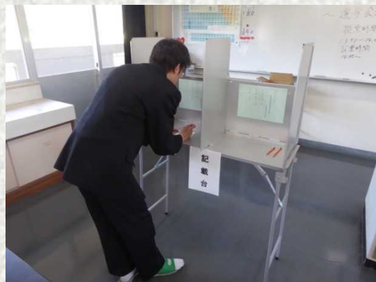
模擬投票ですが皆さん少し緊張した様子でした