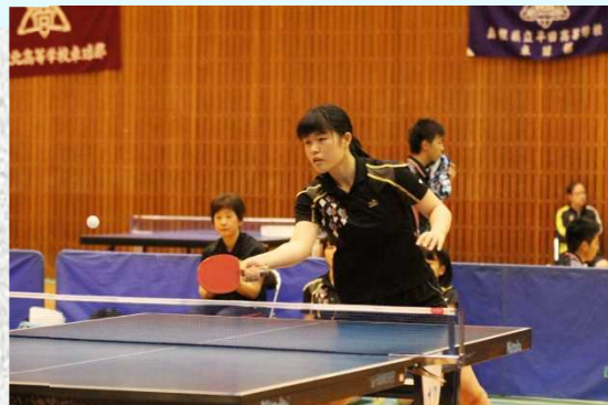
卓球部女子 総合5位