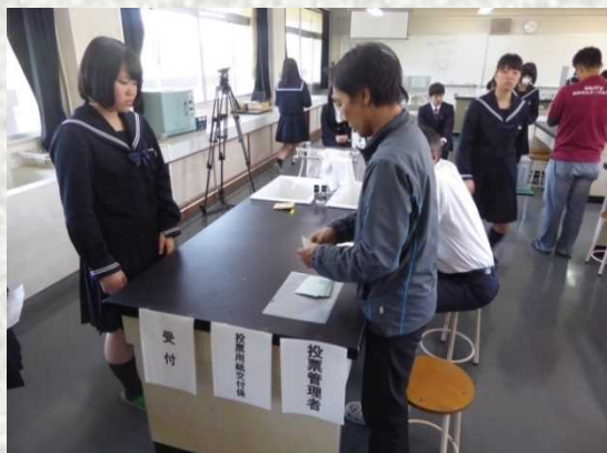
選挙の模擬体験しました