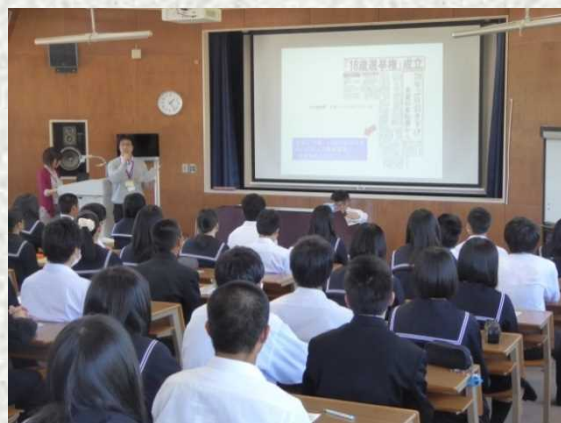
邑南町選挙管理委員会の方による説明

公職選挙法の改正により、選挙権が18歳となったことに伴い、矢上高校の3年生の中には今年実施の選挙に一票を投ずる権利を持つ生徒もいます。邑南町選挙管理委員会の方々にお越しいただき、選挙の制度についてわかりやすい説明をいただき、その後に模擬投票を実施し、投票の雰囲気を感じました。国・地方で色々な選挙が行われていますが、若年層の投票率が低い状態が続いています。このことが自分達にどんな影響があるのか…これまでは「選挙なんて面倒だ、自分一人が投票しても何も変わらない」という思いを抱いていた生徒も、授業を終えて自分が一票を投ずることによって変わることもある、まずは選挙に行くことが大事だという思いになったようです。